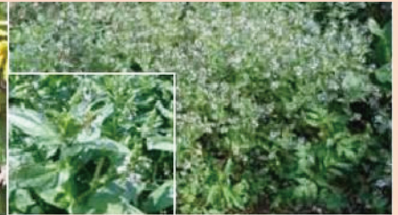
(3) オオカワテシャ(大川高苳)

在来種のカワテシャ(準絶滅危惧種)と交配して雑種を形成するため、遺伝的かく乱を生じています。