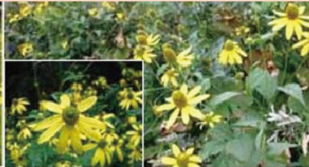
(2) オオハンゴンソウ(大反魂草)

繁茂した地域では在来植生への影響が懸念されています。過去に園芸種としてルドベキア、ハナガサギクという名で流通しました。