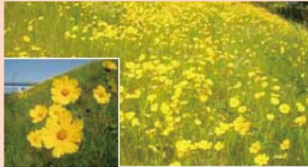
(1) オオキンケイギク(大金鶏菊)

過去に園芸用や緑化用に流通した経過があり、河川敷や道路に大群落をつくっています。